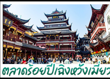
ตลาดร้อยปีเมืองหังเหมย์