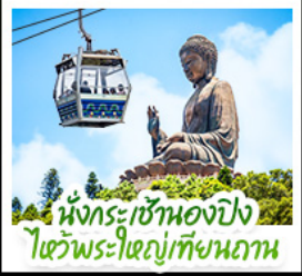
นั่งกระเช้าเองปีง ไซ้พระใหญ่เทียนถาน