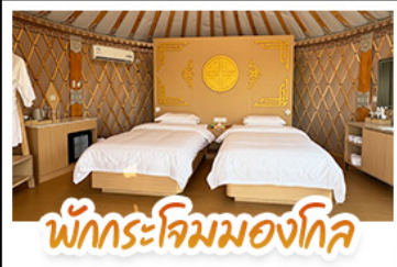
พักกระโจมมองไกล