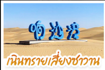
เนินทรายสีงาช้าง