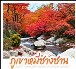
ภูเขาเขามู่ซางชาน