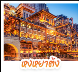
แสงยามค่ำคืน

สัมผัสใบไม้แดงสุดงดงามที่ อุทยานเขาสงา และ อุทยานทงอู่ชาน ชมวิวกลางคืนสุดอลังการที่ หงหยาดัง แลนด์มาร์กชื่อดังแห่งฉงชิ่ง สักการะพระโพธิสัตว์เจ้าแม่กวนอิม ณ วัดหลิงฉวน ขอพรเสริมสิริมงคล เช็กอินแลนด์มาร์กสุดฮิต เพนด้าป็นตึก IFS + POP MART ช้อปปิ้งจุใจที่ ไท่กุ่หลี่ ถนนคนเดินซุนซู่