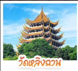
วัดเลิ่งฉวน