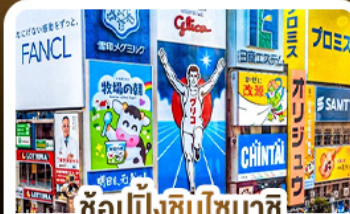
ซ้อปั้งชินโซบาชิ และโดตงโมริ