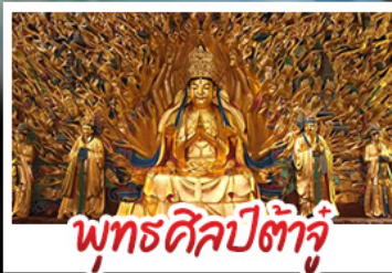
พุทธศิลป์ต้าจู้