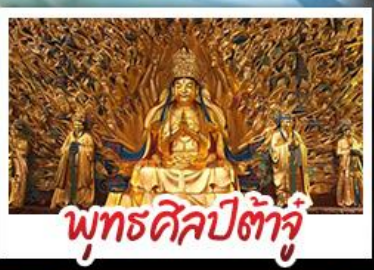
พุทธศิลป์ต้าจู๋