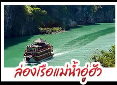
ล่องเรือแม่น้ำอู๋ฮัว

ดงซิง - อู่หลง - เวียนเจียง หลุมฟ้าสามสะพานสวรรค์ - หงหยาดัง พุทธศิลป์ต้าจู๋ - ล่องเรือแม่น้ำอู๋ฮัว