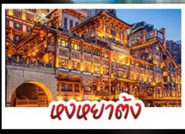
ตงเซาตัง