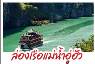
ล่องเรือแม่น้ำอู่ฮั่น

ฉงชิ่ง - อุ๋หลง - เจียนเจียง หลุมฟ้าสามสะพานสวรรค์ - หงหยาดัง พุทธศิลป์ต้าจู้ - ล่องเรือแม่น้ำอู่ฮั่น