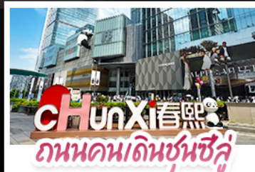
ถนนคนเดินชุนชู่