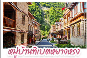
หมู่บ้านทิบตหยางตรง

ตะตุ๋นเจียงเจียงน ต้ากู่ปิงชาน ชวนเซ็กคินแพนด้ายักษ์ พักใจที่หยดน้ำดาสีฟ้า! แวะซีลเมืองโบราณลั่วไต้ สัมผัสสมดส์สน์ หมู่บ้านทิบตหยางหงฮวาเตอ สัมผัสความหนาวเย็นที่ อุกยานสวรรค์ธารน้ำแข็งต้ากู่ปิงชาน แหล่งรวมวิวหลักล้าน ตื่นตากับแสงสียามค่ำคิน หยดน้ำดาสีฟ้า ณ สะพานหนานเฉียว เมืองตุ๋นเจียงเจียงน ก่อนปิดท้ายด้วยการช้อปปิ้งจุใจ ถนนชุนชู่-ไท่กู่หลี่ และเซะภาพกับ แพนด้าเซลฟี่ สุดคิวท์