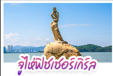
จูเซฟิซอร์ริกริล