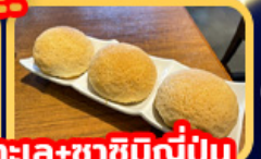
บุฟเฟ่ต์ชาบูพรีเมียม สุกี้อาหารทะเล+ชาฮิมิญี่ปุ่น ดื่มชาระดับมิชลินสตาร์