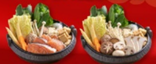
สุกั้ปลาแซลมอน+สุกั้เห็ด