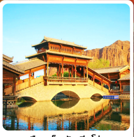
เมืองเล็กต้นเซีย่ชิว