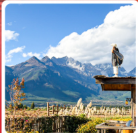
คาเฟ่ YUN DI AN