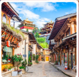
เมืองโบราณแชนกรีล่า

ไฮไลท์...บินตรงลงลี่เจียง นั่งกระเช้าชมภูเขาหิมะมังกรหยก เช็กอินคาเฟ่ฮอตฮิต YUN DI LAN CAFE