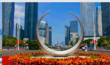
จัตุรัสฮัวเจิง

*ทางบริษัทฯ ขอสงวนสิทธิ์ในการสลับโปรแกรมทัวร์ตามความเหมาะสมขึ้นอยู่กับสถานการณ์หน้างาน โดยคำนึงถึงผลประโยชน์ของลูกค้าเป็นสำคัญ