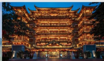
วัดต้าฝ่อซื่อ