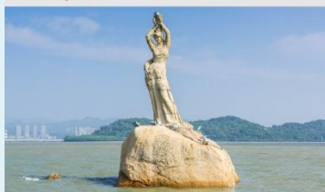
จูไห่พีชเชอร์เกิร์ล(หวีหนี่)