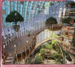
ห้างการค้าเดินถ่วงหวน