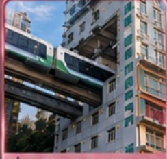
นั่งรถไฟทะลุติ๊ก 2 สถานี