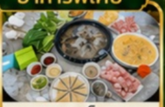
ชาบูเห็ด