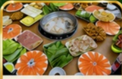
ชาบูแชลมอน