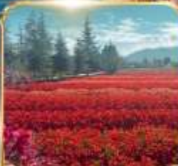
สวนดอกไม้ HUA YU MU CHANG