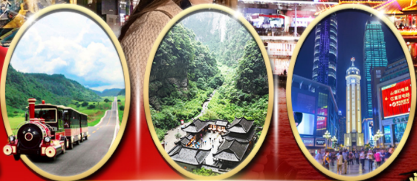
อุทยานเขานางฟ้า อุทยานหลุมฟ้า สะพานสวรรค์ ถนนคนเดินเจียฟางเป็ย