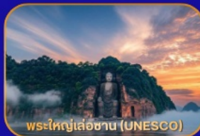
พระใหญ่เล่อซาน (UNESCO)