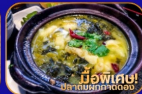
มีอพิเคซู่! ปลาต้มผักกาดดอง