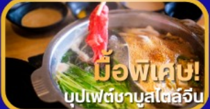
มือพิเศษ! บุปเฟ่ต์ชาบูสไตลิ่งจีน

เดินทาง : สิงหาคม - ตุลาคม 2569 6 วัน 4 คืน น้หนักกระเป๋า 23kg