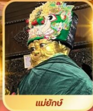
แม่ยี่ภย์