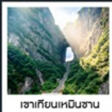
เขากิยเนเหมินซาน

ล่องเรือลำน้ำถั่วเจียงชมเมืองฟ่งหวงยามค่ำคืน / สะพานสายรุ้ง / เมืองโบราณฟ่งหวง น้ำตกฟูหรงเจิ้น / เขากิยเนเหมินซาน / ระเบิดขี้เถ้า / ประตูละคร / ไร่ชาฉางจื่อ / ไร่ชาฉางจื่อ ตึก 72 ชั้น / แกนנדี้แค่นยอน / สะพานแก้ว / เขาวตาร / สวนจอมพลเอ่อหลง ห้างเหวินเหอโฮ่ว / ถนนหวงซิงลู่ (POP MART) / ซุปบิงเอ๋อเล็กอางซา