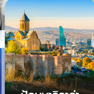
ป้อมนาริกาล่า