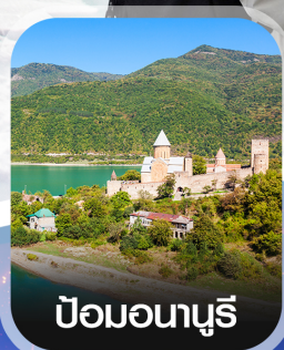
ป้อมอนาบูรี