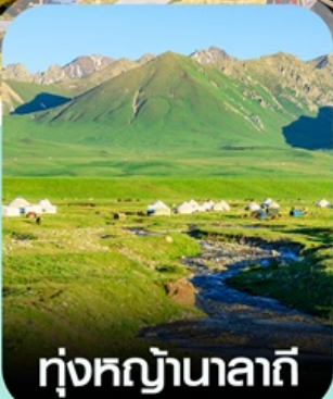
ทุ่งหญ้านาลาถี