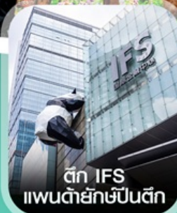
ตึก IFS แพนด้ายักษ์ป็นตึก