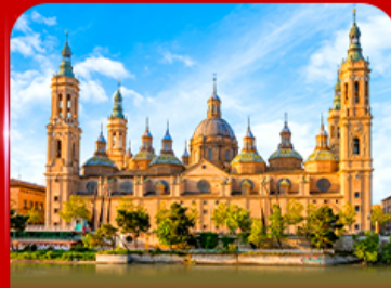
มหาวิหารแม่พระแห่งเสาคักดีสิกรี