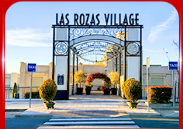
Las Rozas Village เอาทีเลีย