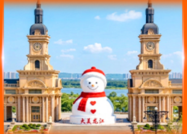
ตึกตาสหิมะยักษ์ ฮาร์บิน