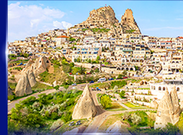
หุบเขาอูซึซาร์ คัปปาโดเกีย