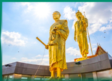
หลวงพ่อคุณ วัดบ้านไร่