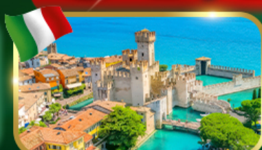
เมืองสวยริมทะเลสาบ เซอร์บิโอเน่