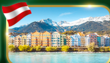
อินส์บรุค เมืองสวยเทือกเขาแอลป์