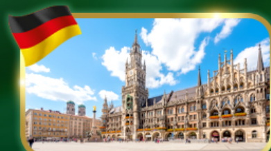
เช็คอิน จัตุรัสมาเรียนพลัทซ์