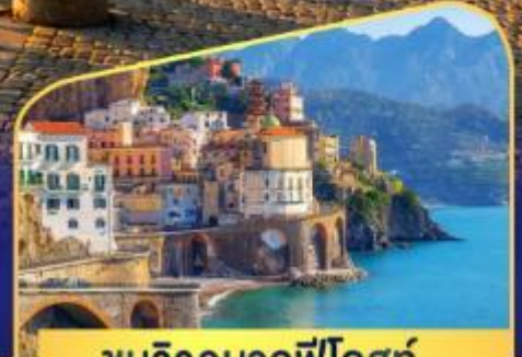
ชมวิวมอลฟีโคสก์