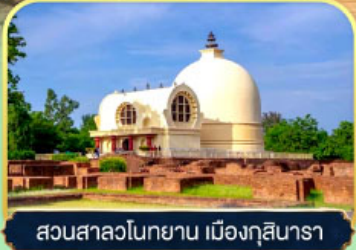
สวนสาละวินกายน เมืองกุสินารา