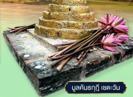
มุลคันรฤฎี เขตตะวัน