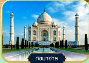
ทัชมาฮาล