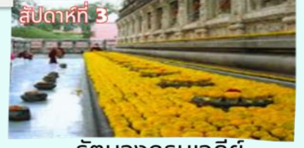
รัตนองกรมเจดีย์