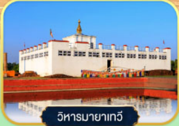
วิหารมายาเทวี