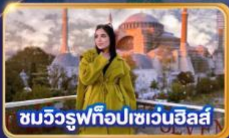
ชมวิวยูฟท็อปเซเวนฮิลส์