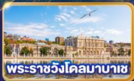
พระราชวังโดลมาบาเซ