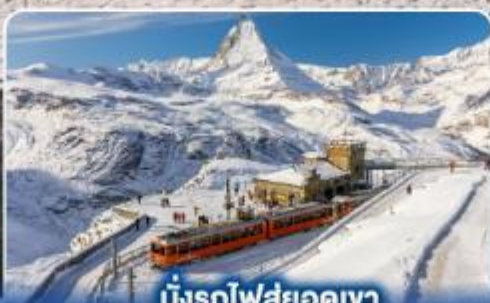
นั่งรถไฟสู่ยอดเขา กรอนเนอร์เกรต