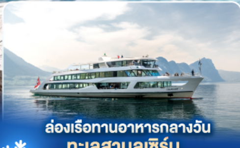
ล่องเรือทานอาหารกลางวัน ทะเลสาบลูซิิร์น