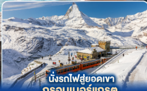
นั่งรถไฟสู่ยอดเขา กรอนเนอร์เกรต