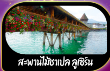
สะพานไม้มิชาเปค คูชีริน