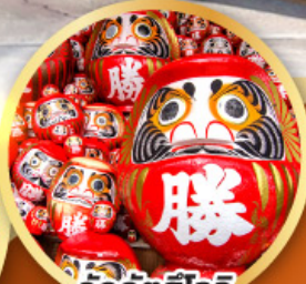
วัดคิตสึโองิ (วัดดามะ)

ชมความงามของกำแพงหิมะ เส้นทางสายอัลไพน์ ทากายามา (JAPAN ALPS SNOW WALL)