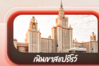
เห็นเขาสเปร์ไร