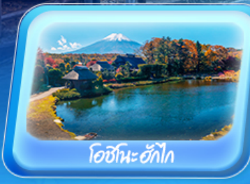
โอชิโนะฮักไก