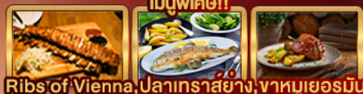
เมนูพิเศษ!! Ribs of Vienna, ปลาเทราสียง, จาหมูเยอรมัน