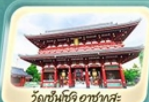
วัดเซ็นโซจิ อาซากุสะ