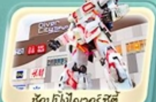
ช้อปปิ้งไอเวอรี่ ซิตี้

ชมวิวภูเขาไฟฟูจิ สวนโออิชิ หมู่บ้านน้ำใสโอชิโนะ อักโท เยือนวัดเซ็นโซจิ อาซากุสะ ตลาดปลา Toyosu ช้อปปิ้งจุกี่ห้างดัง ไอเวอรี่ ซิตี้