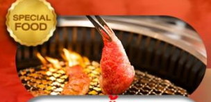
SPECIAL FOOD อาหารมือพิเศษ ปิ้งย่างยากินิกุ