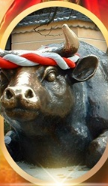
ศาลเจ้าดาไซฟุ