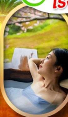
แช่บ่อนอนเซ็นญี่ปุ่น