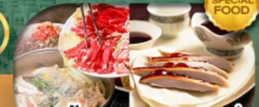
เมนู: สุกี้มอญโก + เปิดปักกิ่ง เดินทาง เม.ษ. - ต.ค. 69