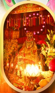
เจ้าแม่กวนอิมทองคำ