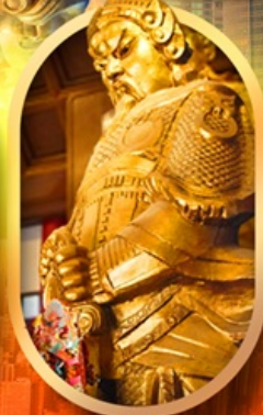
เทพวัดแซง

เที่ยว 2 ประเทศ ฮ่องกง วัดดัง ช้อปปิ้งจุใจ