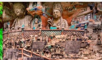
ผาหินแกะสลักต้าจู่ เป่าติงซาน