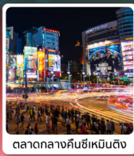
ตลาดกลางคืนซีเหมินติง