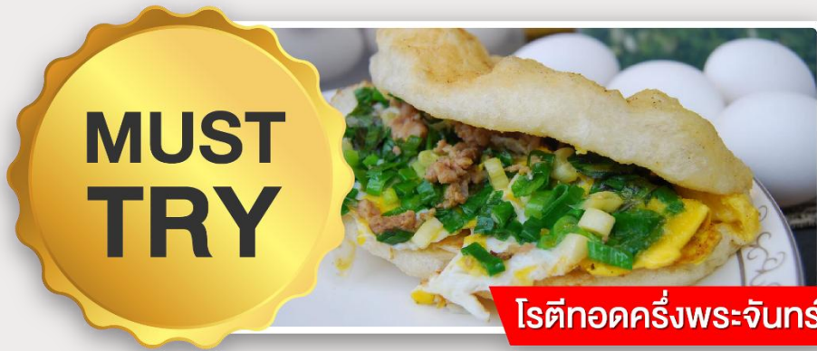
โรตีกอดครึ่งพระจันทร์

อิสระอาหารเย็นตามอัธยาศัย ณ ตลาดกลางคืนอิง