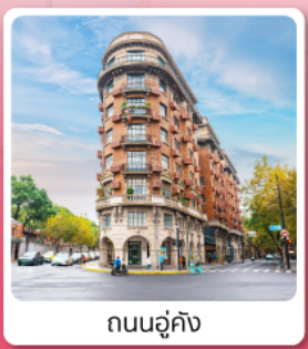
ถนนอู๋คัง