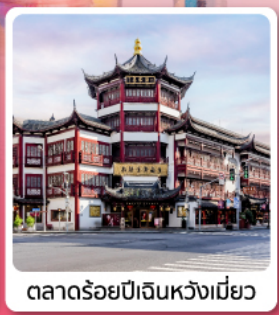
ตลาดร้อยปีเงินหวงเมี่ยว