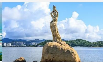
จูไห่ฟิชเชอร์เกิร์ล(หวีหนี่)

*ทางบริษัทฯ ขอสงวนสิทธิ์ในการสลับโปรแกรมทัวร์ตามความเหมาะสมขึ้นอยู่กับสถานการณ์หน้างาน โดยคำนึงถึงผลประโยชน์ของลูกค้าเป็นสำคัญ