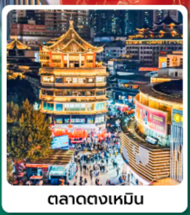
ตลาดตงเหมิน

• โฮเทล OH Bay เป็นแลนด์มาร์คท่องเที่ยวและศูนย์การค้าทันสมัยมีทะเล กวนอูในเซินเจิ้น ขึ้นชื่อเรื่องการช้อปปิ้ง โชคกลาง บาร์มี ความสำเร็จในการทำงาน