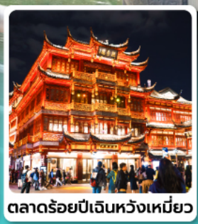
ตลาดร้อยปีเงินห้วงเหมี้ยว