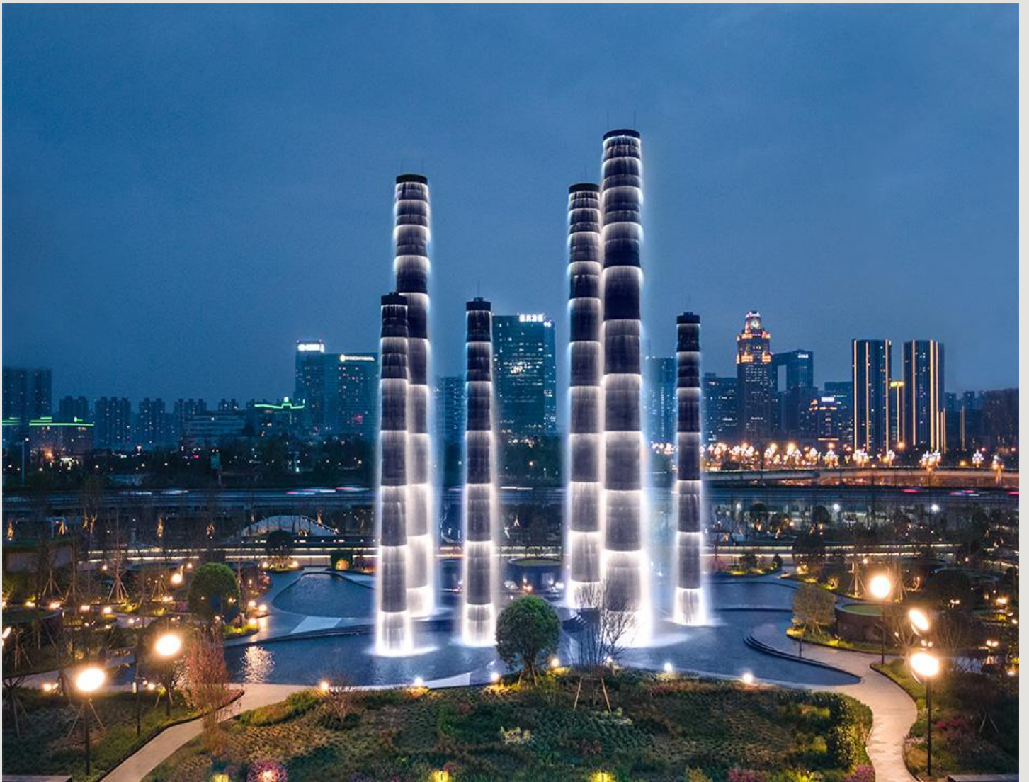
ที่พัก โรงแรม XINGCHEN HANGDU INTERNATIONAL HOTEL ระดับ 5 ดาวมาตรฐานจีน หรือเทียบเท่า