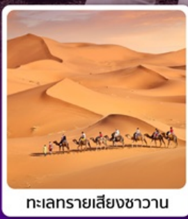
ทะเลทรายเสียนชวาน

• โฮลไก้ เนินทรายเสียนชวาน แหล่งท่องเที่ยวระดับ 5A ภูเขาไฟอูลันฮาตา พิพิธภัณฑ์ภูเขาไฟตามธรรมชาติ