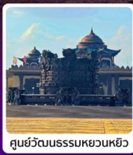
ศูนย์วัฒนธรรมหยวนหยิว