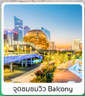
จุดชมชมวิว Balcony