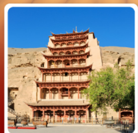
ถ้ำหินมั่วเกาตุ