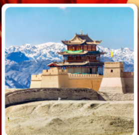
กำแพงเมืองจีนด่านเจียหยวี่กวน

• โอโหล่...เส้นทางสายไหม ชมสระน้ำวงพระจันทร์ ทะเลทรายหมิงซาซาน กำแพงเมืองจีนด่านสุดท้าย "เจียหยวี่กวน" มรดกโลกภูเขาสายรุ้งจางเย่